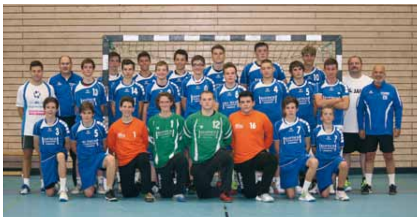
Die starke B-Jugend.